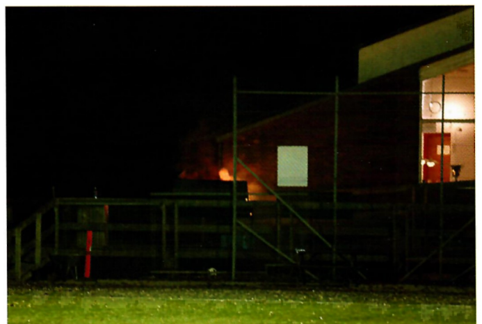
Når der skal laves mad til så mange, må man tage den udendørs grill i brug, så det var ikke fordi terrassen var ved at futte af, at der var ild.